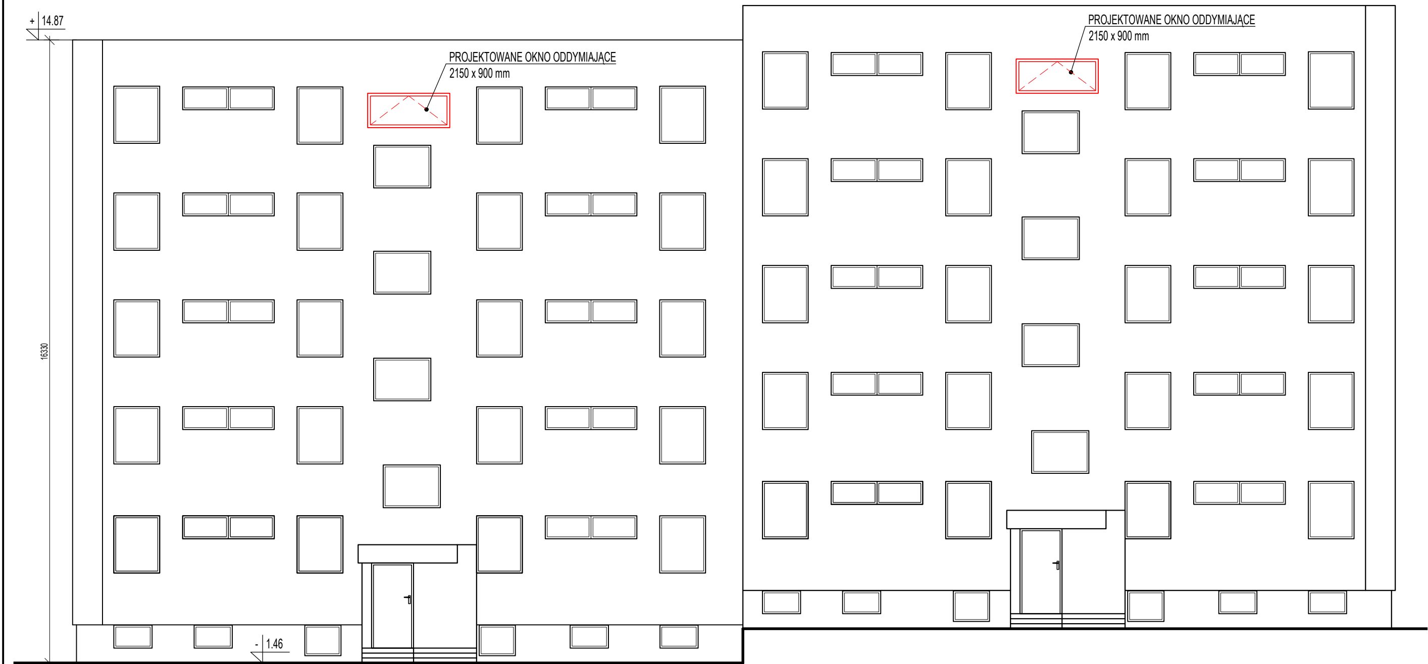
Rys. A5. ELEWACJA WSCHODNIA skala 1:100